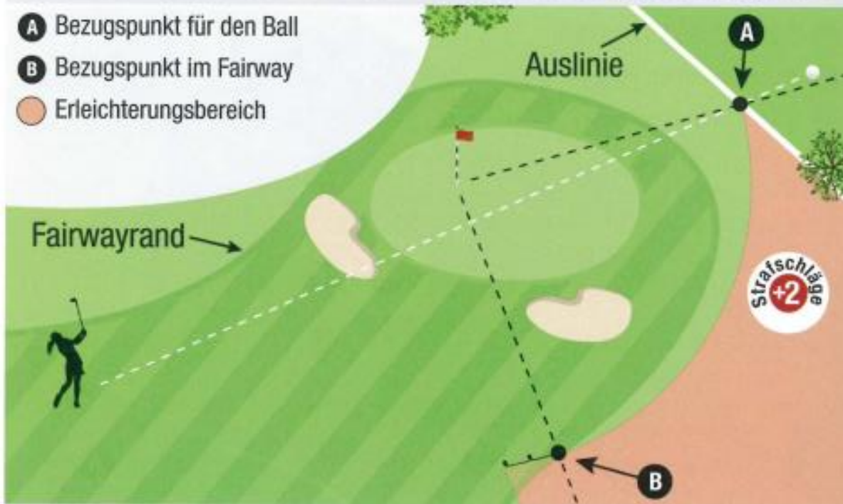
MPR E-5 ABB. 3: BALL IN DER NÄHE DES GRÜNS NICHT GEFUNDEN ODER IM AUS

Wurde der Ball eines Spielers nicht gefunden, oder ist es bekannt oder so gut wie sicher, dass der Ball im Aus ist, darf der Spieler Erleichterung mit Schlag und Distanzverlust in Anspruch nehmen oder, falls die Musterplatzregel E-5 in Kraft gesetzt wurde, hat der Spieler die zusätzliche Möglichkeit, einen Ball mit 2 Strafschlägen in dem unten beschriebenen Erleichterungsbereich zu droppen und von dort zu spielen.